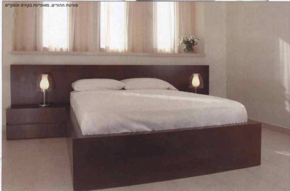
סוויטת ההורים. מאופיינת בקווים אופקיים

בניית הגבס בסלון מתחברת להנמכות תקרה המשמשות את תעלות המיזוג, ומונצלות גם לאלמנטים שונים של תאורה נסתרת, השוטפת את הקיר האחורי באור רך ונעים ומייצרת תלת-ממדיות ומשחקים של אור וצל.