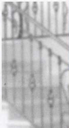
בתמונות: חיבור בין השקפות מגונדות בחדר המגורים